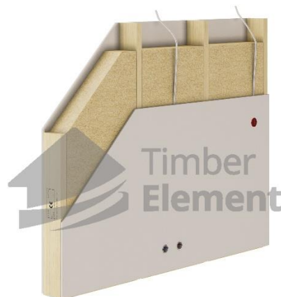
Kandvate siseseinade kihid