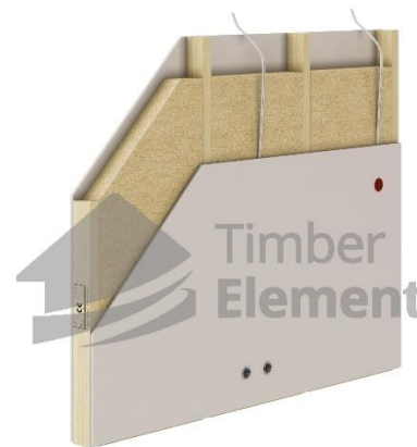
Mittekandvate siseseinade kihid