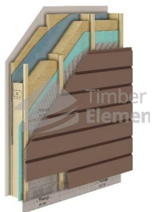
Välisseinade kihid (voodrilaud)