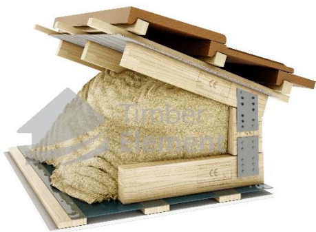
Katuse fermide lahendus