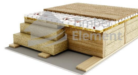
Vahelae kihid (2 ja enam korruselistel majadel)